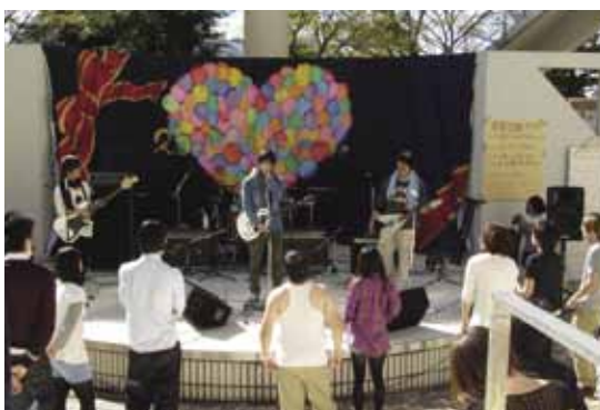
音につられて観客が集まる。練習の成果、出せたかな？