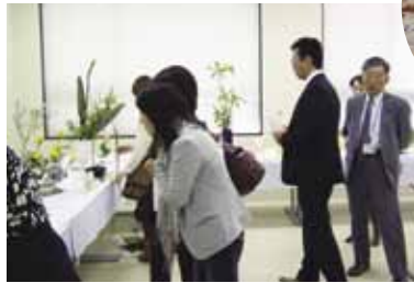
↑部員、OG（卒業生）とのつながりをひもを使って表現した合同作品