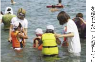
▲震災後、初めて海に入る子どもたちをサポート