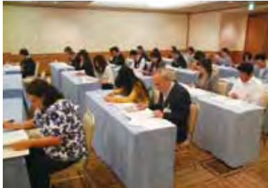
真剣な面持ちで資料に目を通す参加者（北陸地区／新潟市）

新潟会場では19世帯27名の保護者が熱心に耳を傾けた。久村会長の挨拶に続いて、安井学長が「教育とはなかなか結果が目に見えづらいものだが、明海大に入って子どもがこんなに成長したと実感し、明海大の教育力を感ずるほしい」と、教育システムや環境への揺るぎない自信を語った。 その後、就職状況などについて、鈴木学生支援課長が報告。「求人活動のスケジュールが変わり、企業側も戸惑っていたようだ。先に出した内定を学生に辞退され、再募集する