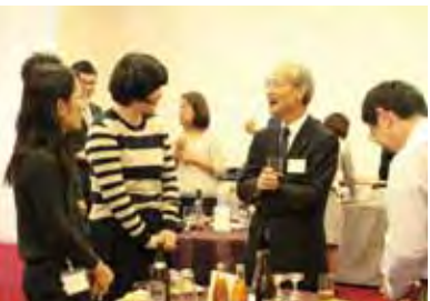
緊張の糸もほぐれ、和やかな雰囲気の中懇親会（東北地区／福島市）

その後、立食形式の懇親会に。おいしい料理を囲みながら、楽しく情報交換する姿が見られた。