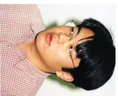
青島隆典学友会副会長