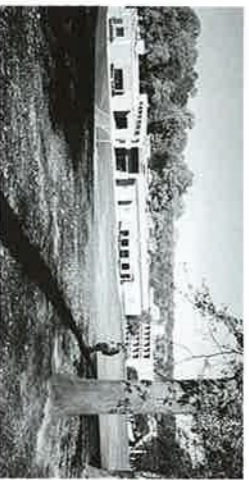
ヒーバーカレッジ

秋晴れの空の下、私たちが乗せたマイクロバスは快適なドライブである。1. ラトガータウンシップのカーエントリアでは側50ヤードは緩衝緑地帯で、その樹々は見事に赤や黄色に紅葉して美しい。誰でも知っているアメリカの国土の広さについては、モリター大の様にコーナから多額の寄付を受け、ラトガータウンの様には都市全体にいくつものカレッジが点在している感じが交差し、約50台の無料大型バスが循環しており、2つ以上のカレッジに学祭時には時として移動時間を1時間以上みないといけないこともあるとかで、逆に狭い日本の大学が利点にさえ見えて