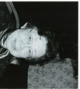
明海大学浦安キャンパス 発刊の運びとなり、心から お慶び申し上げますと共に、 第二の十年期に入つたこと につきまして教育後援会を育て て来られた会員の皆様、と ますが、『潮風』第十号